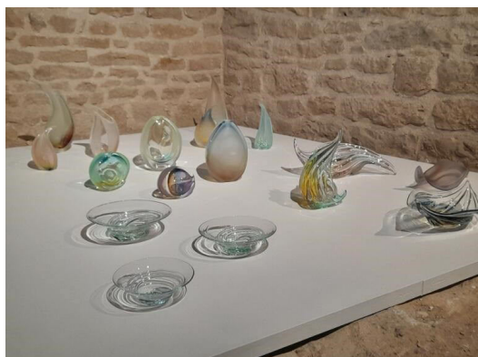
Exposition temporaire au Musée des Beaux Arts de Nancy d'un artiste japonais en résidence au CERFAV.